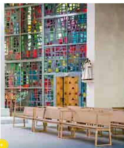
Vitrail réalisé par Max Ingrand et la statue de Notre-Dame.