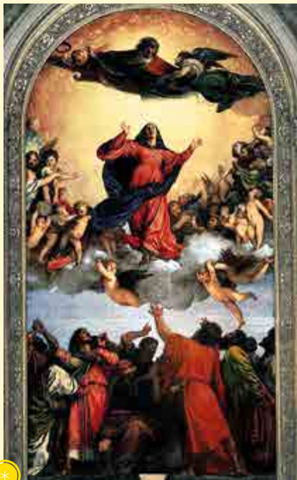
L'Assomption de la Vierge par Titien (1515-1518).