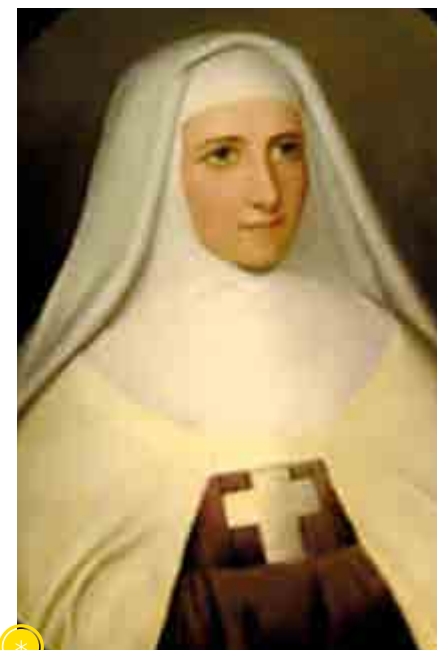
La jeune fondatrice, Mère Marie-Eugénie de Jésus.