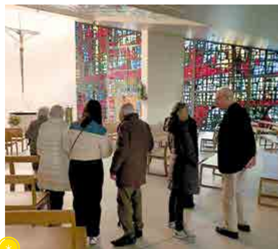
Dans la chapelle des sœurs.

guerre, qui lui aussi a contribué à la reconstruction de nombreuses églises avec ses verrières. Ici, il réalise un grand vitrail non figuratif (à l'exception d'un Christe), très coloré, qui occupe toute la paroi du côté droit du triangle. L'entrée est également ornée de verrières. Sur un pilier, on trouve un souvenir de l'enfance de Mère Marie-Eugénie: une petite statuette de Notre-Dame, dotée de beaux vêtements anciens qui changent selon les périodes et fêtes liturgiques. Elle provient de la chapelle du château de Preisch.