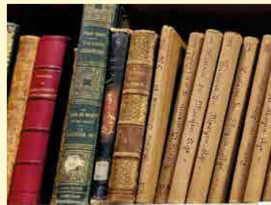
Les nombreux ouvrages et les livres de cours de Marie-Eugénie.