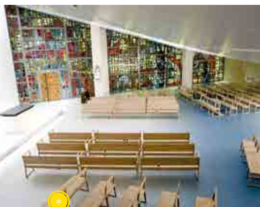
Intérieur de la chapelle.

En 2007, la canonisation de Mère Marie-Eugénie entraîne un afflux de pèlerins. Il faut rendre les lieux plus "fluides" pour eux, tout en maintenant la communauté des sœurs, l'adoration et la prière, ainsi que les offices ouverts aux habitants du quartier. Les sœurs confient le projet au cabinet d'architectes "3Box" et le mobilier au designer Stéphane Lacoua. Le sol est aplani, d'un seul niveau au lieu de deux auparavant; le plafond devient une toile tendue; l'autel est une plaque de granit noir sur un socle blanc (avec une relique de la sainte). Les stalles disparaissent, remplacées par des bancs en chêne clair. La tombe de Mère Marie-Eugénie est déplacée à l'arrière de l'autel et les pèlerins peuvent s'y rendre directement depuis l'entrée.