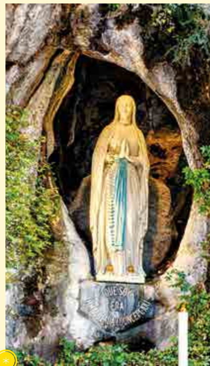
La grotte de Massabielle à Lourdes, haut lieu de pèlerinage.

Marie représentée élevée vers le ciel, entourée d'anges, vêtue de blanc ou de bleu. Souvent avec une couronne d'étoiles (Ap 12,1).